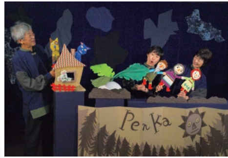
【スタッフ】 構成・演出：柿内尚生 美術：和田周子 音楽：八幡美佳 【キャスト】 出演：林達美 八幡美佳 飯田恵美

おじいさんが育てたかぶは立派に育ちました。 「おいしくいただきましょう！」 ところが…… あんまり大きくて、いくら引いても抜けません。 おばあさんが手伝っても、さっぱりダメ。 あらまあ、さてさて、どうしましょう？！ ごぜんじロシア民話を、生演奏とともに楽しく贈ります！