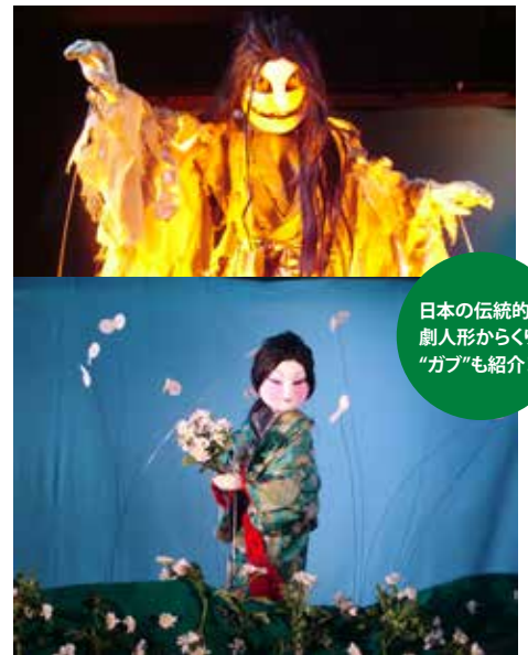
日本の伝統的な 劇人形からくり “ガブ”も紹介！

悪さばかりのあまんじゃくと元気いっぱいうりこひめが会場いっぱい に繰り広げるドタバタ攻防戦！