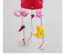
イベント画像2 「簡易つるし雛」

開催日 2月1日(土)2日(日) 10:00~/12:00~/15:00~ 会場 3階イベントスペース 定員 各回15名 ※小学2年生以下は保護者同伴 参加費 400円 ※別途入館料が必要 申込 当館HPにて申込受付中