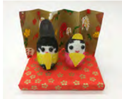
イベント画像1 「まゆ玉ひな人形」

開催日 1月25日(土)26日(日) 2月15日(土)16日(日) 各日10:00~定員になり次第終了 会場 3階イベントスペース 定員 当日受付/各日先着25名 ※小学2年生以下は保護者同伴 参加費 400円 ※別途入館料が必要