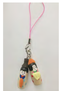
イベント画像4 「ひな人形ストラップ」

開催日 2月29日(土)3月1日(日) 各日10:00~定員になり次第終了 会場 3階イベントスペース 定員 当日受付/各日先着25名 ※小学2年生以下は保護者同伴 参加費 500円 ※別途入館料が必要