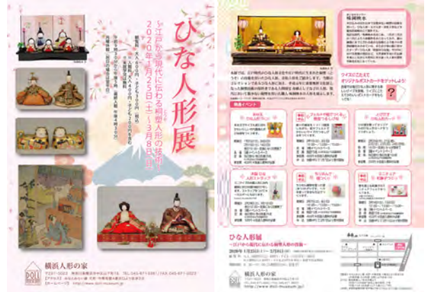
展示チラシ オモテ/ウラ