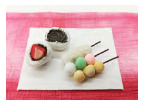
イベント画像6 「ミニチュア和菓子」

開催日 3月14日(土)15日(日) 10:00~/12:00~/15:00~ 会場 3階イベントスペース 定員 各回15名 ※小学2年生以下は保護者同伴 参加費 400円 ※別途入館料が必要 申込 当館HPにて2月15日より受付開始