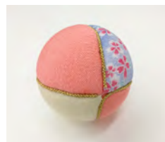
イベント画像5 「まり玉ちりめん」

開催日 3月7日(土)8日(日) 10:00~/12:00~/15:00~ 会場 3階イベントスペース 定員 各回15名 ※小学2年生以下は保護者同伴 参加費 400円 ※別途入館料が必要 申込 当館HPにて2月1日より受付開始