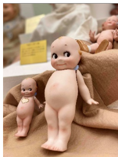
世界の人形クイズ