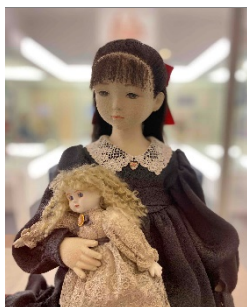
横浜と人形の歴史